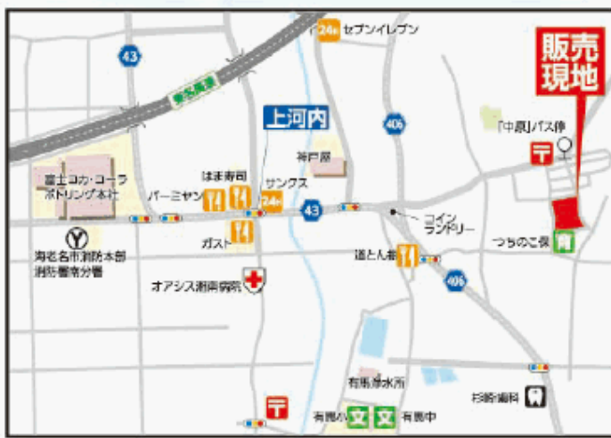
Car Navi 海老名市杉久保南4-23付近

【土地価格】1,750万円(5区画)~2,080万円(1区画)【最寄価格帯】1,700万円台:8区画(※100万円単位)【交通】小田急・相鉄・JR相模線「海老名」駅バス13分徒歩3分【土地】120.11㎡~132.36㎡【開発総面積】8452.28㎡【地目】宅地(況況造成中)※平成29年7月末造成完了予定※許可No.神奈川県指令厚土東築610079号【用途】第1種住居地域【建ぺい率】60%【容積率】200%【設備】公営水道・公共下水・都市ガス・東京電力【幅員】東側約6m、南側約6m、西側約6.5m~7.8m【所在】海老名市杉久保南4丁目【売主】株式会社サーティーフォー神奈川県知事免許(6)第20195号※建築条件付(全17区画販売)(媒介)